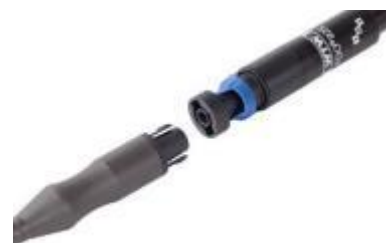
ケーブルはワンタッチ装着 タイプDOセンサー: FDO925-P型