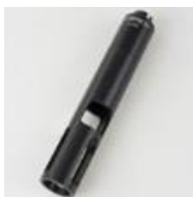
電極保護筒 A 925-P/K